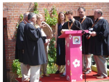
Die Schirmherrin des transnationalen LEADER+ - Projektes, Ministerin Petra Wernicke (3.v.l.), wurde im Rahmen der Eröffnungsveranstaltung am 22. Juli im altmärkischen Seethen als Ehrenmitglied in die Bruderschaft französischer Gastronomen aus der Partnerregion Centre aufgenommen.

Unter den Gästen weilte eine Gruppe französischer Freunde aus der sachsen-anhaltischen Partnerregion Centre. Im Vorjahr hatten die Altmärker das EuroLandArt-Festival der LAG in Pays de Beauce