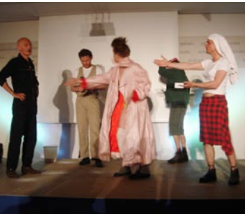
Künstler des TdA-Ensembles zeigten Kostproben der spektakulären Shakespeare-Inszenierung, die im Sommer 2006 auf dem Klostergelände in Arendsee open air zu sehen ist.