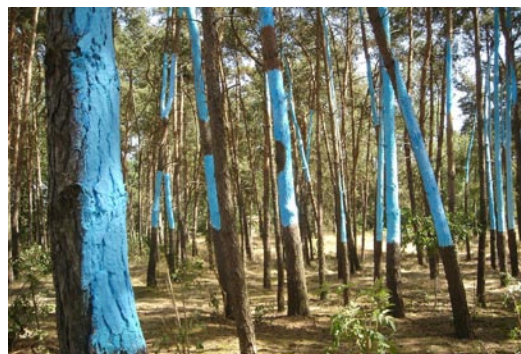
„Alétheia“ – so der Titel des EuroLandArt-Kunstwerkes in Steinfeld. Das Wort beschreibt im altgriechischen das „Aha“-Erlebnis das man hat, wenn man noch nicht verknüpfte Elemente zu einem sinnvollen Ganzen zusammenfügt.

Ohne sie ging nichts bei EuroLandArt: Die Kunstpaten. An jedem der sieben Standorte haben sie sich um die Bedürfnisse der Künstlerinnen und Künstler gekümmert. Sie halfen ihnen bei der Suche nach Materialien, Helfern und Unterkünften und gaben Unter-